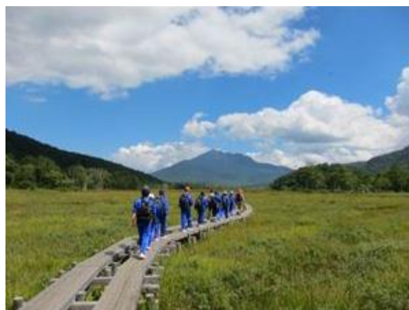
Oze National Park in Gunma e la Oze School, Japan